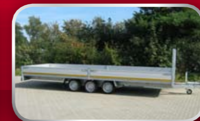
PL35G / slede