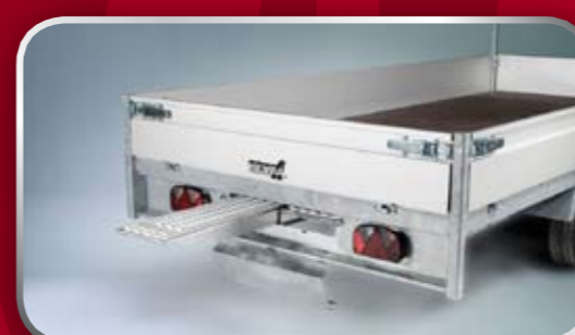
Slede ten behoeve van rijplaten