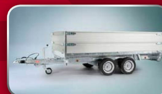
Dubbele aluminium borden