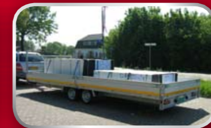
PL35G / slede