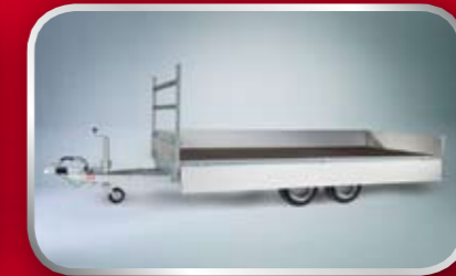
PL20C / slede