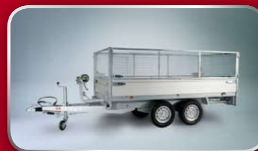
Loofrekken en handlier