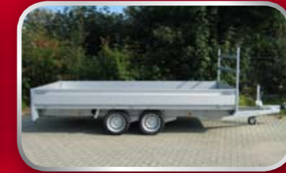
PL27C / slede